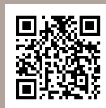
Imagen de portada:

Portrait gallery of eminent men and women of Europe and America. With biographies , 1872.