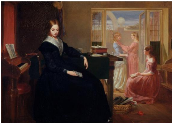
La institutriz , Richard Redgrave, 1844 Victorian and Albert Museum.

Tuvieron una existencia difícil; la pérdida de los seres queridos fue una constante, las muertes del único hermano, Branwell, de Emily y Anne se sucedieron en unos pocos meses, todos de tuberculosis, el mal familiar. Sólo Charlotte consiguió sobrevivirles algo más y saborear las mieles del éxito como escritora, una profesión entonces mal vista en las mujeres.