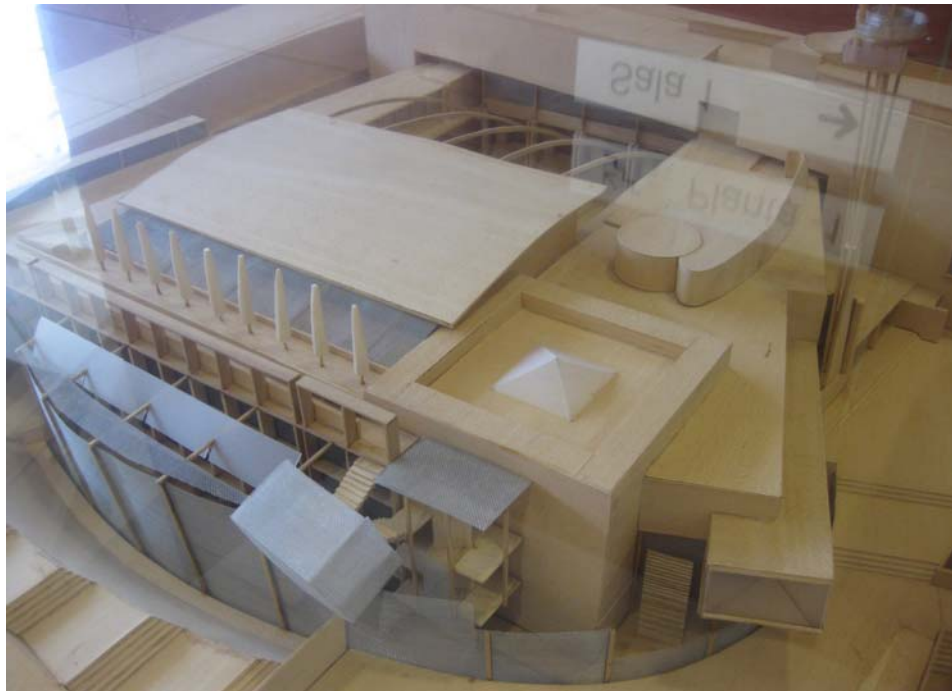
Maqueta de la Biblioteca de Ciencias