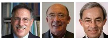
Peter A. Diamond / Dale T. Mortensen / Christopher A. Pissarides Premio Nobel de Economía 2010

- Premio Príncipe de Asturias de Comunicación y Humanidades 2010, concedido ex aequo a Alain Touraine y Zygmunt Bauman