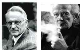
Alain Touraine / Zygmunt Bauman Premio Príncipe de Asturias de Comunicación y Humanidades 2010