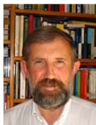
Gerardo Meil Landwerlin Premio "La Caixa" de Ciencias Sociales 2009

Existe además en nuestras páginas una sección dedicada, a modo de homenaje, a la memoria de profesores e investigadores de nuestra facultad ya fallecidos. Todas ellas constan de una reseña biográfica y una aproximación bibliográfica, con especial hincapié en las obras del autor disponibles en el catálogo de la UAM; además de una recopilación de enlaces de interés sobre el autor y su obra.